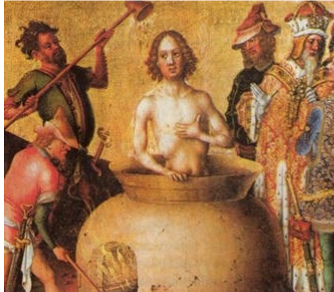
Hi. Johannes überlebte Martyrium i. siedendem Öl Grab in Ephesus

4- John (Gioan): con ông Giê-bê-đê, được Chúa Giêsu gọi là Môn đệ yêu dấu. Đối diện với cái chết tử đạo khi bị nấu trong nồi dầu sôi trong cuộc bách hại tôn giáo ở Rôma. Nhưng lạ thay, ngài được cứu thoát khỏi cái chết. Thánh Gioan bị kết án đi làm hầm mỏ tại trại tù ở đảo Patmos. Tại đây, Ngài đã viết cuốn sách Khải Huyền chứa đầy những lời tiên tri. Thánh Gioan được trả tự do, và trở về làm Giám mục ở Edessa, Thổ Nhĩ Kỳ. Ngài chết vì già yếu. Ngài duy nhất là tông đồ đã chết một cách bình an.