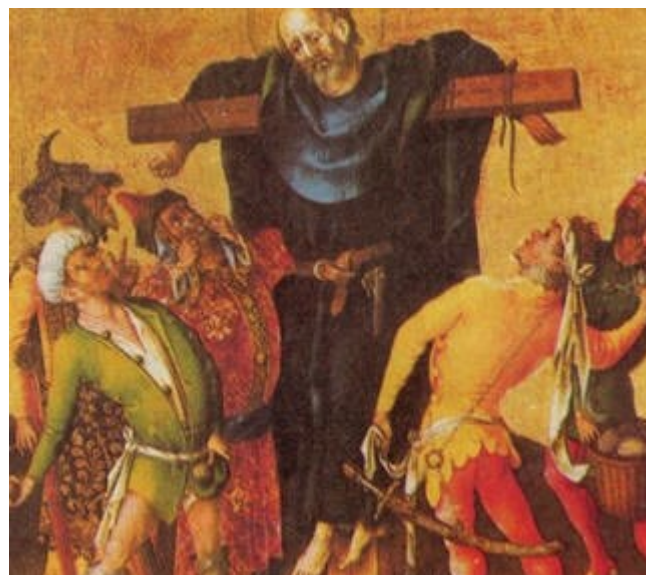
Hi. Philippus gegeißelt/gekreuzigt/gesteinigt Grab in Rom

5- Philip (Philiphê): người thành Bethsaida xứ Galilee, bị đóng đinh.