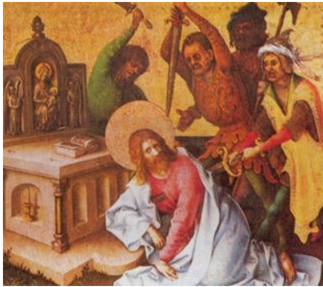
Hl. Matthäus verbrannt/gesteinigt Grab in Salerno und Rom

8- Matthew (Mát-thêu): người thu thuế, con trai của Alphaeus. Tử đạo ở Ethiopia, chết vì vết thương của lưỡi gươm.