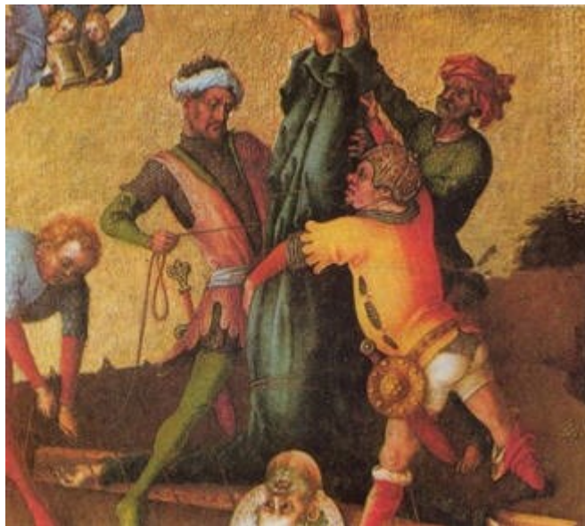
Hl. Petrus kopfüber gekreuzigt Grab im Petersdom

1- Simon Peter (Phêrô): Chúa Giêsu gọi ngài là đá, còn được gọi là Simon con Giôna. Ông là một ngư phủ đến từ thành Bethsaida xứ Galilee. Đã bị đóng đinh ngược trên thập giá. Theo lời truyền của giáo hội thì ngài đã nói với những người lý hình rằng, ngài cảm thấy không xứng đáng chết cùng một thể thức giống như Chúa Giêsu, cách Thầy mình đã chết.