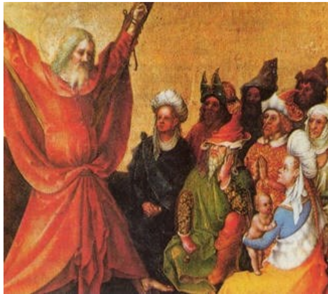
Hl. Andreas gekreuzigt (Andreaskreuz) Byzanz/Amalfi/Patras

Thánh giá đã được tận hiến nhờ thân xác của Chúa Kitô treo trên đó”. Ngài tiếp tục rao giảng cho những tên lý hình trong hai ngày cho đến khi tàn hơi.