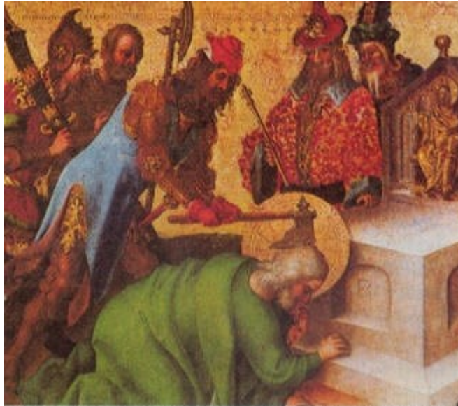
HI. Mathias gesteinigt/erschlagen Grab in Trier

13- Mathias (Mátthia): thay thế môn đệ Giuđa phản bội, bị ném đá và bị chặt đầu.