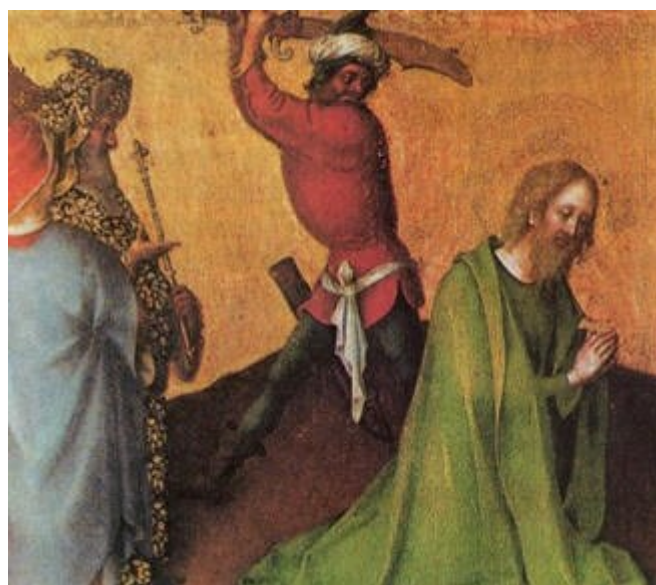
Hl. Jakobus d. Ä. enthauptet Grab in Santiago de Compostella (zuerst Jerusalem)

3- James the Great (Giacôbê Cả): con ông Giê-bê-đê, là anh em với thánh Gioan. Là người chài lưới khi Chúa Giêsu gọi ngài làm môn đệ hiến trọn đời cho sứ mạng rao giảng tin mừng. Là người lãnh đạo can trường của Giáo hội, Giacôbê đã bị chặt đầu ở Giêrusalem. Người lính Rôma có nhiệm vụ canh gác Ngài đã kinh ngạc chứng kiến thánh nhân bảo vệ niềm tin trước toà án. Sau này, người lính này cùng đi với Giacôbê tới nơi xử hình. Bị thuyết phục bởi niềm tin, chính ông đã tuyên xưng niềm tin mới với quan toà, và quỳ xuống bên cạnh thánh Giacôbê chấp nhận bị chặt đầu vì là người Kitô hữu.