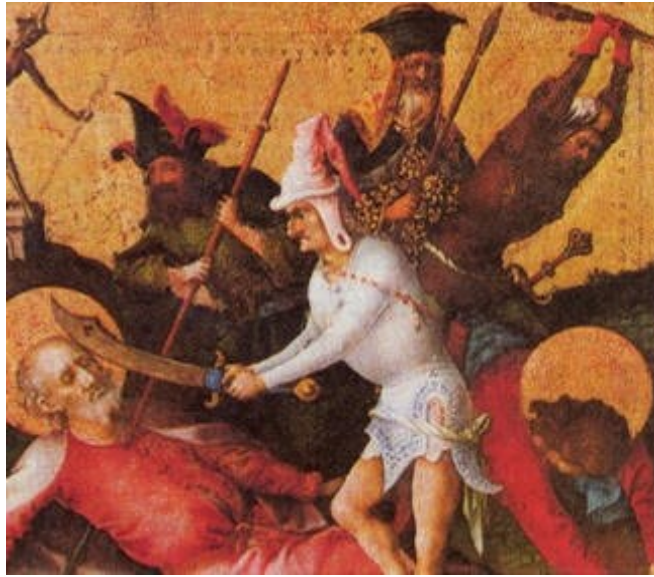
Hl. Simon d. Z. gekreuzigt/zersägt Hl. Judas Thaddäus mit Beil enthauptet Beide Apostel Grab im Petersdom

12- Judas Iscariot (Giuđa "kẻ bội phản"): người đã nộp Chúa Giêsu cho người Do Thái, sau đó hối hận và đi treo cổ tự tử.