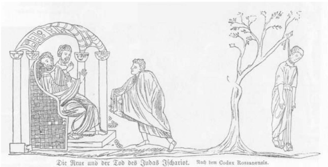
Die Reue und der Tod des Judas Ischariot. Nach dem Codex Rossanensis.

12- Judas Iscariot (Giuđa "kẻ bội phản"): người đã nộp Chúa Giêsu cho người Do Thái, sau đó hối hận và đi treo cổ tự tử.