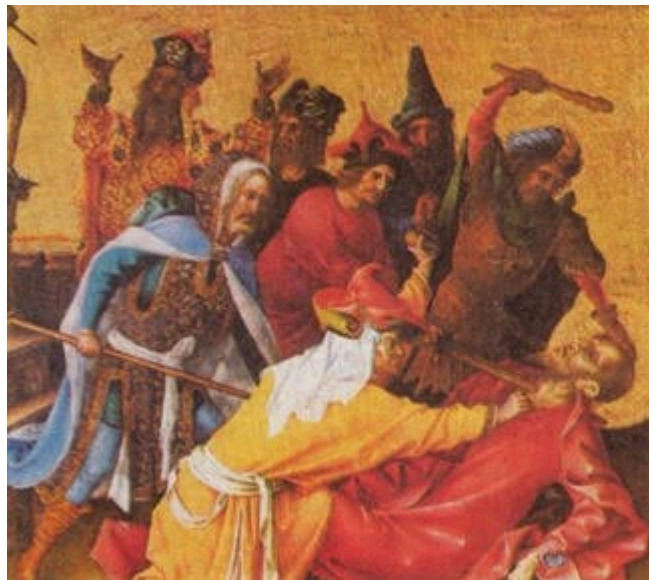
Hl. Thomas mit Lanzen durchbohrt Grab in Ortona

7- Thomas (Tôma): vị thánh duy nhất không tin Chúa Phục sinh, và sau đó đã tin vì đã được thọc tay vào vết thương nơi cạnh sườn của Chúa. Ngài chết vì bị đâm bởi lưới đồng ở Ấn độ, trong một chuyến đi truyền giáo nhằm thiết lập hội thánh tại tiểu lục địa này.