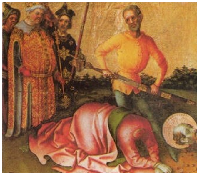
HI. Paulus enthauptet Grab St. Paul vor den Mauern in Rom

14- Thánh Paul (Phaolô): trở nên môn đệ của Chúa Giêsu, sau khi bị Chúa cho té ngựa trên đường đi Đamát bách hại dân Chúa. Phaolô đã tán thành việc ném đá ông Têphanô. Ngài bị tra tấn và sau đó bị chặt đầu bởi hoàng đế Nerô ở Rôma. Thánh Phaolô đã bị giam trong tù một thời gian dài, nhờ đó mà ngài đã có thời gian viết các thư gửi cho các tín hữu của các hội thánh, mà ngài đã thiết lập khắp nơi. Những thư này đã dạy những giáo điều làm nền tảng của Kitô giáo, và các thư này chiếm phần lớn trong sách Tân Ước.