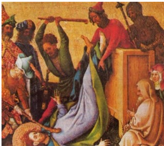
Hl. Jakobus d. J. gesteinigt/erschlagen Grab in Rom

9- James (Giacôbê): con ông Alphaeus. Là người lãnh đạo hội thánh ở Giêrusalem, bị quăng hơn một trăm feet xuống đất từ hướng Đông Nam trên đỉnh của Đền thờ, sau khi ngài không chịu từ chối niềm tin vào Chúa Kitô. Khi người ta khám phá ra là ngài vẫn còn sống mặc dù bị quăng xuống đất từ trên cao, những kẻ thù của ngài đã đánh ngài tới chết bằng cây gậy của người thợ hồ vải. Đỉnh đền thờ này cũng là nơi mà ma quỷ trước kia đã đưa Chúa Giêsu lên để cám dỗ Ngài.