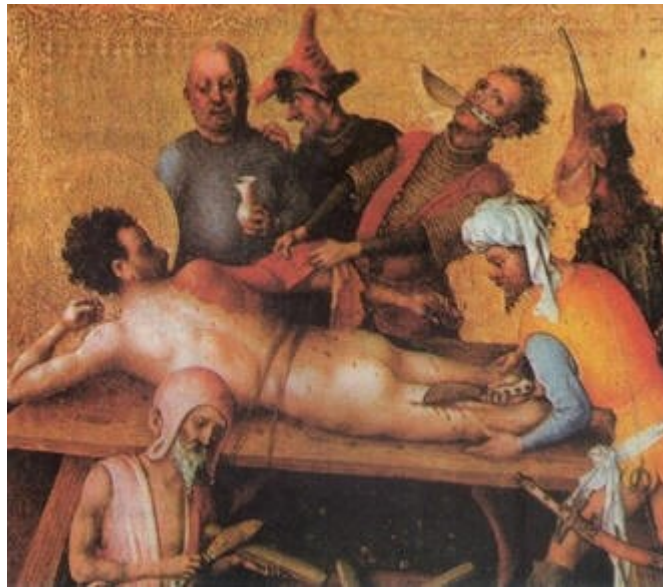
Hl. Bartolomäus lebendig gehäutet/enthauptet Grab in Rom

6- Bartholomew (Batômêô): con trai của Talemai. Ngài làm chứng cho Chúa ở Thổ Nhĩ Kỳ. Batômêô tử vì đạo vì đã giảng đạo ở Armenia, nơi mà ngài bị lột da cho tới chết.